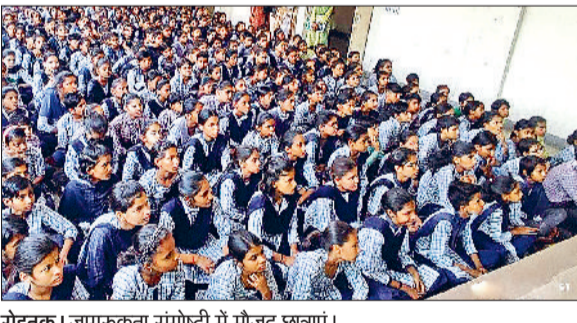
रोहतक। जागरूकता संगोष्ठी में मौजूद छात्र।