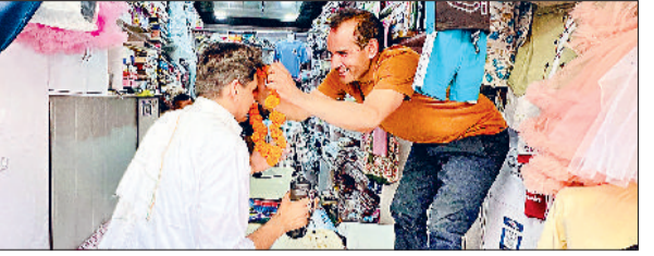
लड़ने तक के उम्मीदवार तक नहीं है और एक तरह से चुनाव लड़ने को लेकर रस्साकस्सी चल रही है, इससे साफ है कि कांग्रेस पहले ही चुनाव में हार मान चुकी है। इस दौरान पूर्व मंत्री कृष्णमूर्ति हड़्दा ने कहा कि इस बार गद्दी सांपला किलोई की जनता पिता पुत्र को सबक सिखा देगी और कांग्रेस शासनकाल के दौरान किए गए भ्रष्टाचार का जवाब दे देगी।

उन्होंने कहा कि हड़्दा तो दिन में भी सीएम बनने के सपने देखने लगे हैं और लोकसभा चुनाव को लेकर पूरी तरह से बौखलाए हुए हैं। उन्होंने कहा कि भाजपा के बढ़ते जनाधार को देखते हुए कांग्रेस के पास चुनाव