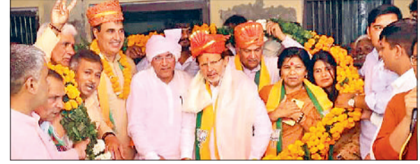
जाकर मुख्यमंत्री बनने की बात करते हैं, जबकि सभी को पता है कि यह चुनाव प्रधानमंत्री बनाने का है ना कि मुख्यमंत्री चुनने का है।

वीरवार को भाजपा सांसद ने गद्दी सांपला किलोई के कई गांवों में जनसंपर्क अभियान चलाया। इसके बाद भाई भतीजावाद चला और जमकर भ्रष्टाचार हुआ। उन्होंने कहा कि किलोई की जनता को सब पता है कि किस तरह से खर्ची पची के नाम पर उन्हें लूटा गया। सांसद ने कहा कि इस बार रोहतक सीट पहले से अधिक मार्जन से भाजपा जीत दर्ज करेगी। डॉ. अरविंद शर्मा ने कहा कि कांग्रेस शासनकाल के दौरान हुई लूट को जनता नहीं भूलती है और पूर्व सीएम हड़्दा का सीएम बनने का सपना कभी पूरा नहीं होगा। उन्होंने कहा कि गद्दी सांपला किलोई के लोगों को चौधर के नाम पर टगा गया है और आज फिर वहीं नेता लोगों के बीच