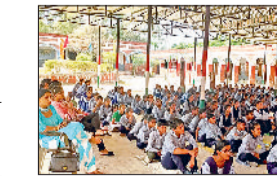
रोहतक। कार्यक्रम में मौजूद छात्र।

उपायुक्त एवं जिला निर्वाचन अधिकारी अजय कुमार ने मतदाताओं का आह्वान किया है कि वे 25 मई लोकसभा आम चुनाव 2024 में अपने को होने वाले मतदान में भाग लेकर लोकतंत्र को मजबूत करें। यदि किसी पात्र व्यक्ति का मतदाता सूची में किसी कारणवश