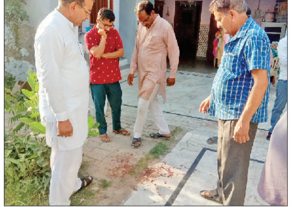
महम। घटनास्थल पर पड़े खून के धबके।

दाखिल हुए। कमरे में पहुंचकर बदमाशों ने महिला के गले से चेन छीनने का प्रयास किया। विरोध करने पर महिला पर चाकूओं से हमला कर दिया। महिला ने शोर मचाया तो मौका पाकर बदमाश भाग गए तथा आपे साथ महिला के गले की चेन, मंगलसूत्र व पर्स छीन ले गए। घटना