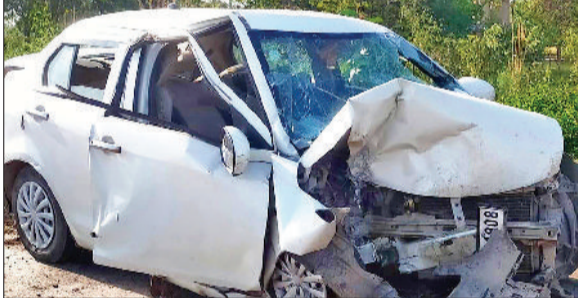
सांपला। हादसे में क्षतिग्रस्त कार।

झज्जर- सोनीपत नेशनल हाईवे पर वीरवार की दोपहर को एक कार डिवाइडर से टकरा गई। सोनीपत गंगा घाट जा रहे थे युवक की मौत हो गई। जबकि पांच घायल हो गए। घायलों में तीन महिला भी शामिल हैं। घायलों को अस्पताल में भर्ती कराया गया।