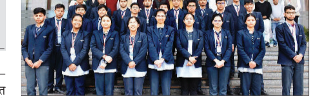
महेंद्रगढ़। खुशी जाहिर करते विद्यार्थी।